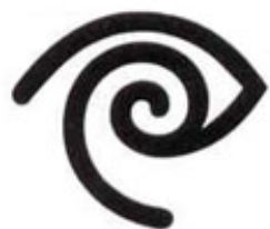
16. Company Time Warner, USA. Design: Steff Geibuhler/Chermayeff & Geismar, 1992.