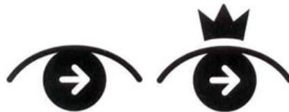
13. Company Sign Groups, UK. Design: Quentin Newark, 1992

No exemplo da Company Sign Groups (figura 13), o olho foi concebido de forma que representasse a informação visual com uma direção (sinalização) que é o de que cuida o Sign Group. A marca coroada é usada em aplicações associadas a prêmios.