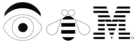
9. Company IBM, International Business Machines, USA. Design: Paul Rand, 1970.

Nesse exemplo da IBM (figura 9), foram usados logogrifos – imagens que podem ser lidas como palavras ou como letras – e que admitem a função lingüística e pictórica das marcas. O olho está entre os mais eficazes desses trocadilhos visuais. Pictoricamente, três símbolos formavam a marca. Lingüisticamente, foram usadas signos que formavam as iniciais do nome da empresa, IBM: eye (“olho” em inglês)+ bee (“abelha” em inglês)+ M = IBM.