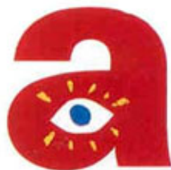
14. Company: The Association. Design: Mike Dempsey / CDT Design, 1987.