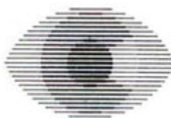
15. Company: Cambridge Contact Lenses, UK. Design: The Partners, 1987.