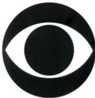
1. O olho da CBS Company (Columbia Broadcasting System), USA. Design: William Golden.

mostrava uma pupila como o diafragma de uma máquina fotográfica que se abria para mostrar a identificação da emissora e, em seguida, se fechava.