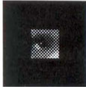
12. Company The Speakeasy Club, UK. Design: Alan Fletcher/Fletcher Forbes Gill, 1965.

No exemplo da Company Sign Groups (figura 13), o olho foi concebido de forma que representasse a informação visual com uma direção (sinalização) que é o de que cuida o Sign Group. A marca coroada é usada em aplicações associadas a prêmios.