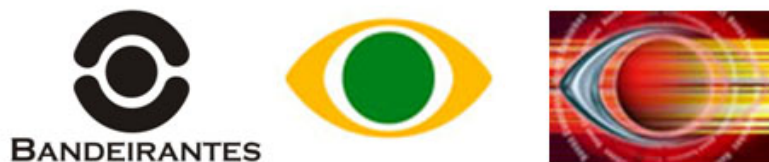
18. Logos da Televisão Bandeirantes de, respectivamente, 1967, 2005 e 2007.

Nos exemplos da Emissora Bandeirantes de Televisão no Brasil (figura 18), a evolução das marcas possuem o mesmo significado da emissora de televisão americana CBS, até por se tratar de um caso, a nosso ver, escancarado de plágio de identidade levado a cabo dentro do mesmo segmento.