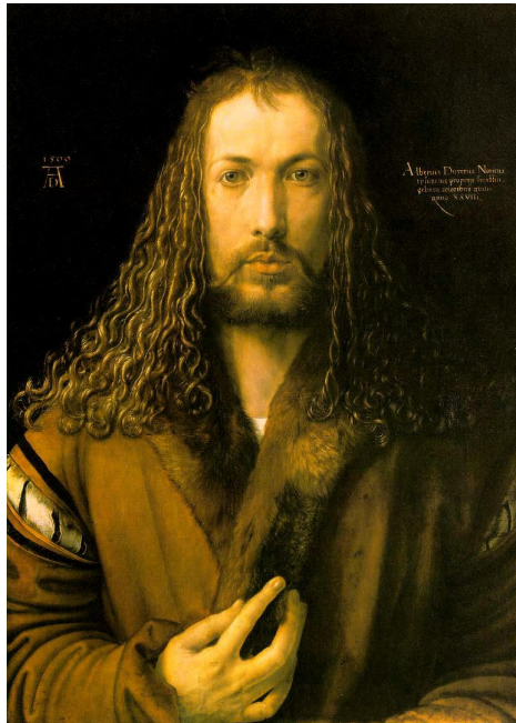
fig.1 – Albrecht Dürer, Auto Retrato aos 28, 1500 Óleo sobre Madeira, 67x49cm, Alte Pinakothek, Munique 24

Ou será o segredo da criação 22 , ou o seu espaço poético 23 , a natureza do objecto artístico? E pode a máquina manipular o segredo da criação? E pode a máquina criar um espaço poético?