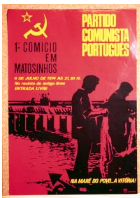
Fig.2 O mundo do trabalho político-partidarizado nas suas mais variadas vertentes (agricultura, indústria, pesca).

PCP - PARTIDO COMUNISTA PORTUGUÊS/ COMÍCIO / TORRES VEDRAS . S.L., PCP, 1975, Offset, 50x70cm. Centro de Documentação 25 de Abril.