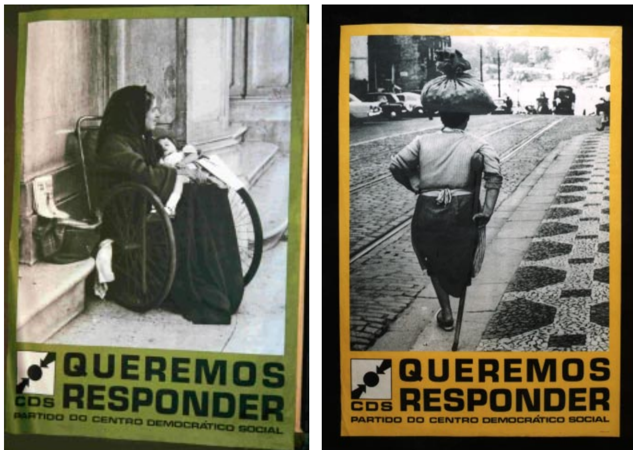
Fig. 6 Dois exemplares da colecção “Queremos Responder” do CDS. A representação do espaço da indigência (a rua) como categoria simétrica à do espaço relativo ao mundo do trabalho (a fábrica).

CDS - QUEREMOS RESPONDER/ CDS/ (deficiente) . S.l., CDS, 1975, Offset, 98x67cm. Comissão Nacional de Eleições.