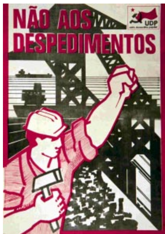
Fig.9 Sobre a refuncionalização político-partidária das ferramentas.

MRPP - ... O TEMPO É DE GUERRA MAS O HORIZONTE É VERMELHO / MRPP. S.l., MRPP, 1974-1975, Offset, 48x68cm. Centro de Documentação 25 de Abril. LCI - 1º Maio / CONTRA O CAPITAL / GOVERNO DOS TRABALHADORES / LCI . S.l., LCI, 1975, Serigrafia, 35x34cm. Partido Socialista Revolucionário. UDP - NÃO AOS DESPEDIMENTOS / UDP . S.l., UDP, [1975], Offset, 40x29cm. Comissão Nacional de Eleições.