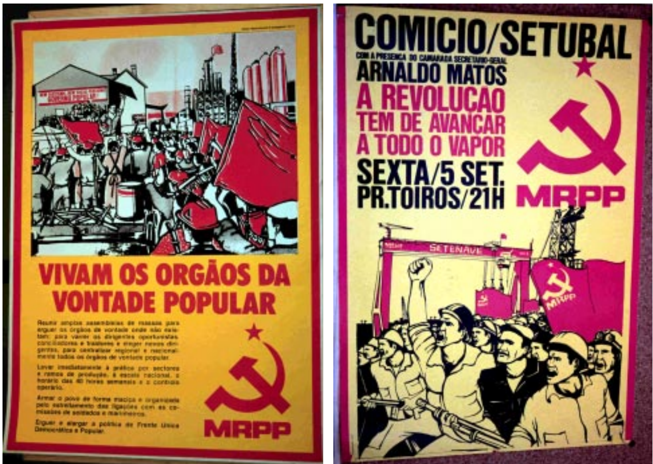
Fig.8 Armas e bandeiras: a partidarização do espaço do trabalho a partir de adereços que lhe são estranhos.

MRPP - VIVAM OS ÓRGÃOS DA VONTADE POPULAR /MRPP. S.L., MRPP, 1975, Offset, 85x61cm. Comissão Nacional de Eleições.