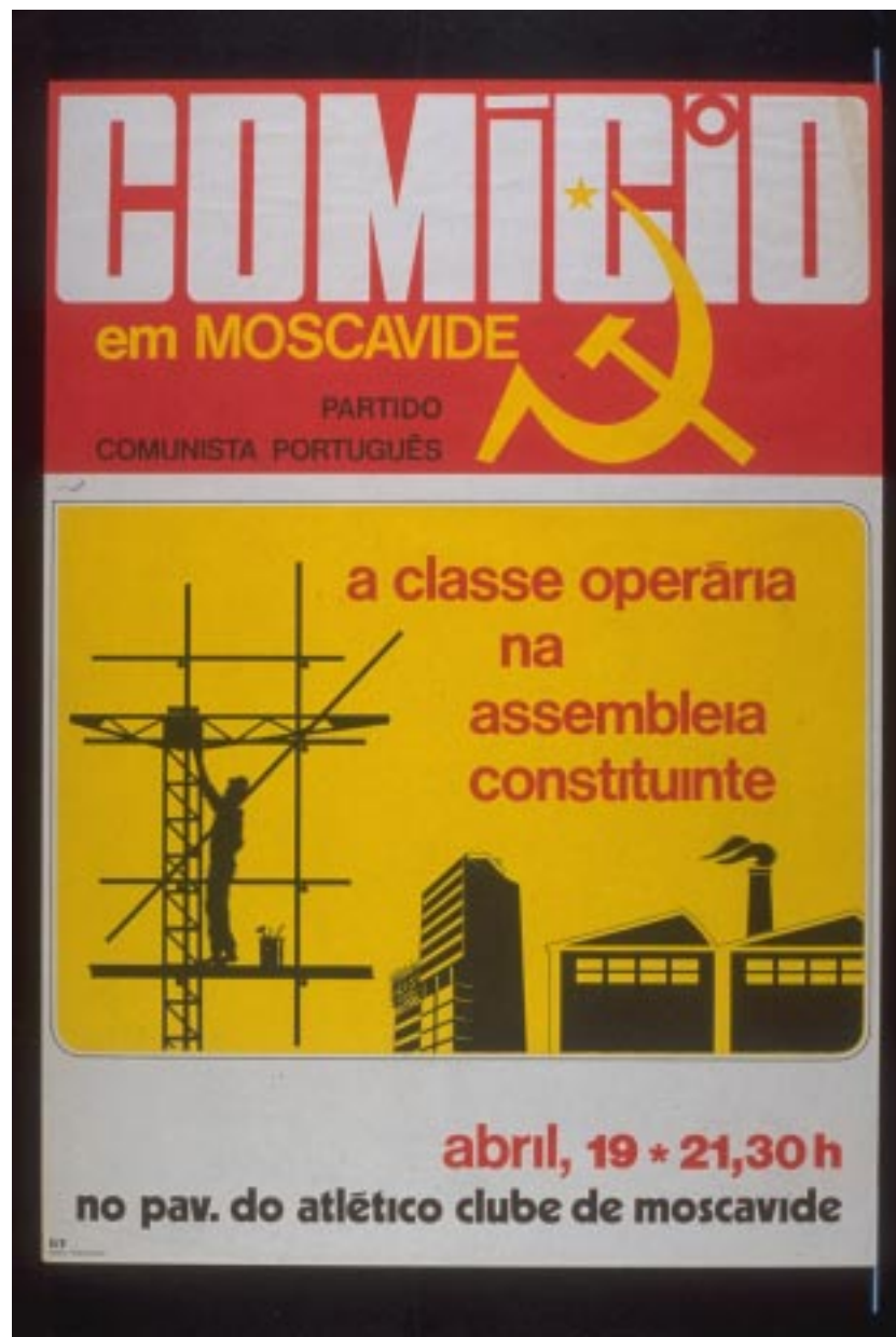
Fig. 3 Situação de justaposição dos signos de identidade institucional em relação à representação iconográfica do mundo do trabalho.

PCP - COMÍCIO em MOSCAVIDE / PARTIDO COMUNISTA PORTUGUÊS . S.l., PCP, 1975, Offset, 65x46cm. Comissão Nacional de Eleições.