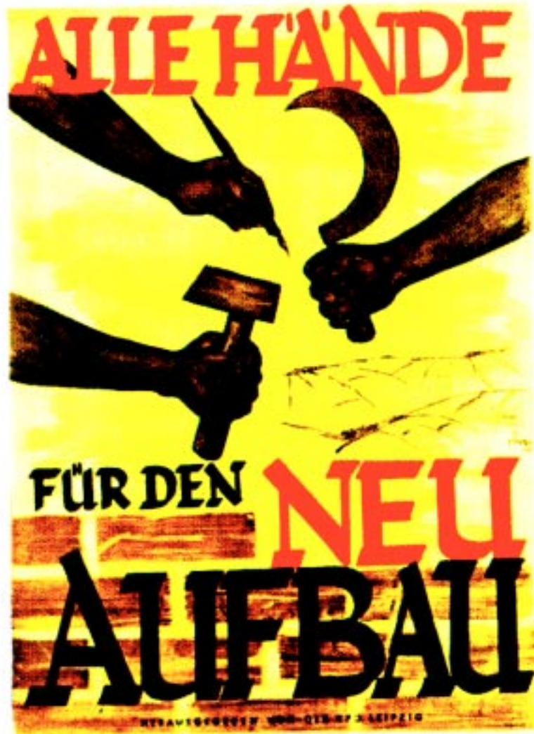
Fig.10 “Alle h’a’nde für den neu aufbau” – “Todas as mãos para a nova construção”: a representação da ferramenta como um recurso ao serviço de um projecto político.

STENGEL, Gerhard- Alle h’a’nde für den neu aufbau . RDA, 1945, in: AUSWAHL, Eine - Politische plakate . Berlim, Verlag für Agitations und Anschauungsmittel, 1979.