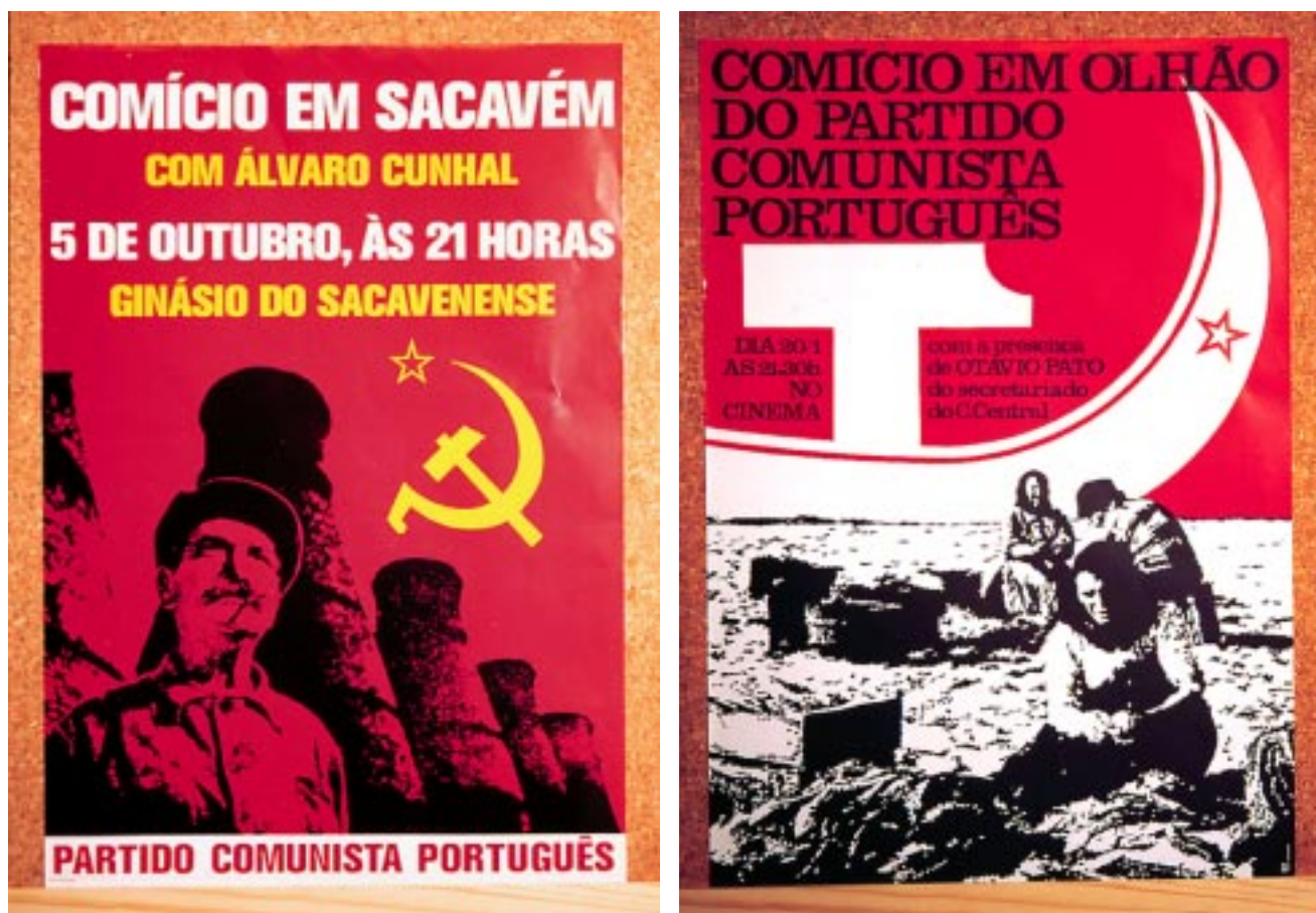
Fig. 4 Situações de sobreposição – ostensiva (à esquerda) ou dissimulada (à direita) - dos signos de identidade no espaço de representação.

PCP/GAGEIRO, Eduardo - COMÍCIO EM SACA VÉM COM ÁLVARO CUNHAL/ PARTIDO COMUNISTA PORTUGUÊS . S.l., PCP, 1975, Offset, 47x33cm. Centro de Documentação 25 de Abril.