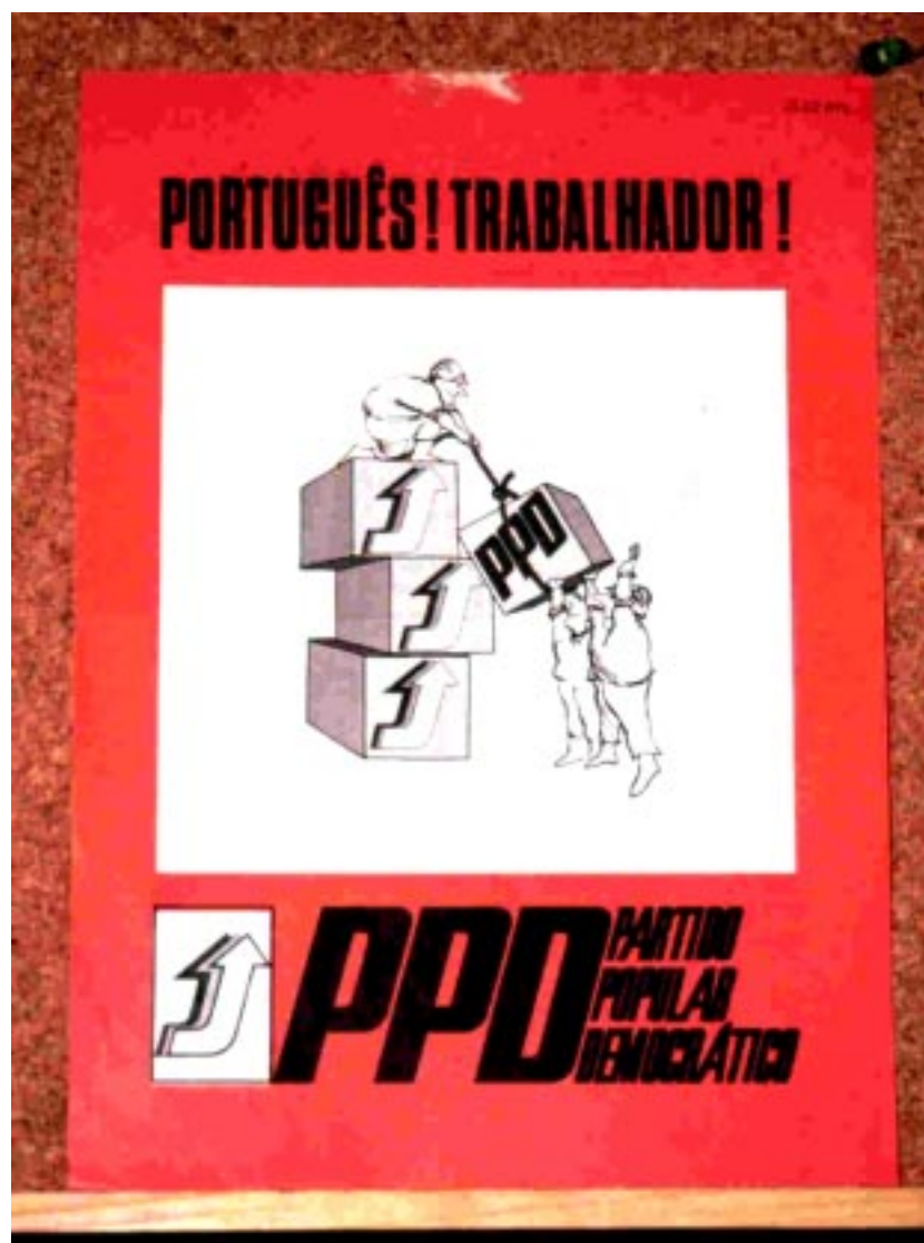
Fig. 5 Situação de coincidência entre a significação de uma identidade político-partidária e a evocação de um mundo laboral.

PPD - PORTUGUÊS! TRABALHADOR! / PPD. S.l., PPD, [1975], Offset, 30x22cm. Câmara Municipal de Lisboa.